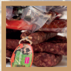
Recepción, control, despique y elaboración de caza mayor