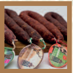
Elaboración y venta de chorizo de jabalí, corzo y ciervo.

Pol. Ind. La Cascajera, 6. MURIETA (NAVARRA) T. 649 044 569 info@centrodecaza.com