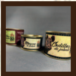
Mousse de jabalí y cordillos de cerdo y de jabalí