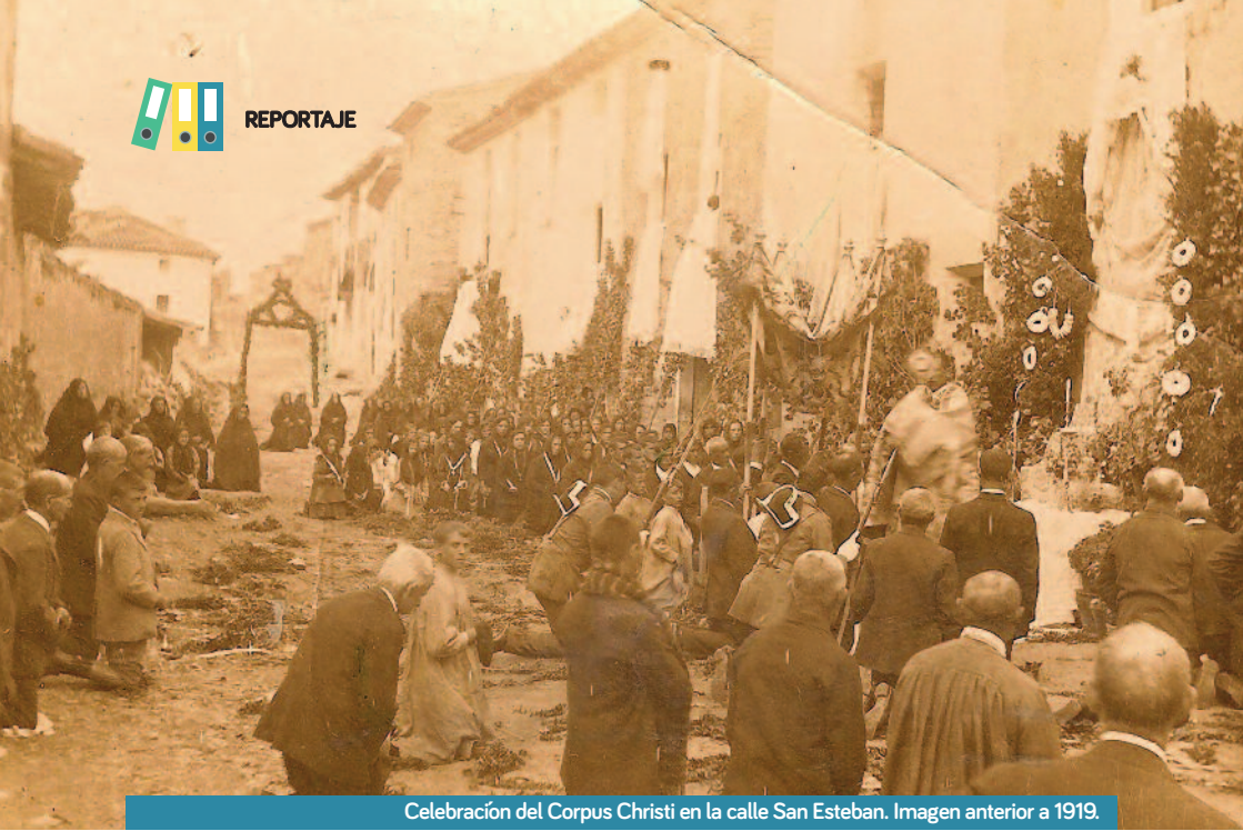
Celebración del Corpus Christi en la calle San Esteban. Imagen anterior a 1919.

tamiento, el puente, la zona de las piscinas... todo me parece fenomenal”.